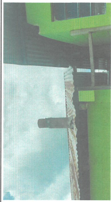
Foto 3: vista de la cubierta de techo de dos cocinas, se remarcará una cocina con estructura de metal y cubierta de techo de lámina troquelada a las dos cocinas, colocación de azulejos, pintura de paredes interiores y exteriores