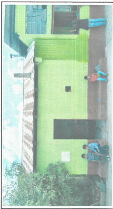
Foto 4: vista del espacio entre cocinas, unificación de paredes, cambio de puertas, colocación de dos ventanas, una adelante y una atrás, construcción de mesa de concreto y lavamanos con azulejo, sustitución de piso de concreto por granito