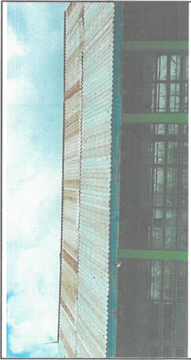
Foto 1: Vista de la cubierta del techo de un aula, se remarcará la cubierta de techo con lámina troquelada y pintada de costaneras