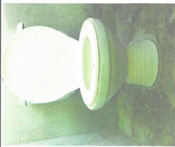
Foto 5: Lavamanos para niños y niñas, migitorio, sanitarios, instalación de azulejos dentro y fuera de cada uno