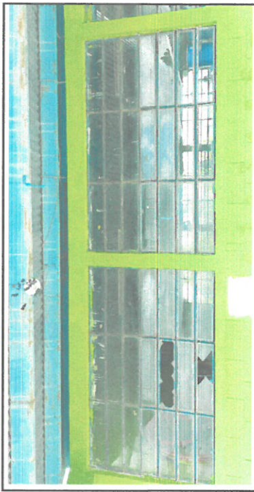
Foto 2: Vista del aula donde se observa el área para instalación de balcones en el espacio de adelante y atrás, cambio de chapa de la puerta del aula